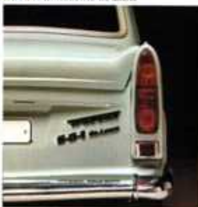
Trabant Limousine de Luxe