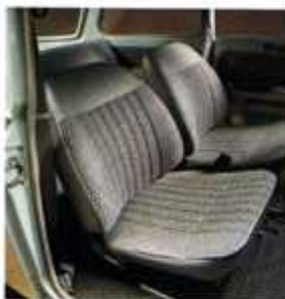
Trabant Limousine de Luxe

Mit «Hycomat» versehene Trabantwagen haben eine automatische Kupplungsvorrichtung. Sie sind also nicht nur für Schwerbeschädigte bestimmt, sondern erleichtern allen anderen Autofahrern das Fahren. Durch Fortfall des Kupplungspedals sind sie besonders für Linksamputierte geeignet, jedoch können auch Rechtsamputierte mit dem linken Bein Gas- und Bremspedal bedienen. – Die Auslieferung für mit «Hycomat» versehene Trabantwagen kann sich bis zu vier Wochen verzögern.