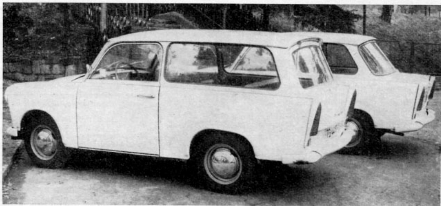
Bild 1 Es fällt schwer, zu entscheiden, welche Heckpartie besser ist — gelungen sind sie beide

Reserverad, Werkzeug, Autobahn-Warnbock usw. haben unter der Ladeplattform Platz gefunden und liegen auf dem Fahrzeugboden. Mindestens für das Werkzeug müßte es Befestigungsmöglichkeiten wie in der Limousine geben. Auch für das Reserverad reicht die Spannung der Zugfedern am Abdeckbrett nicht aus; schon beim Überfahren nur mäßiger Fahrbahnebenheiten rumpelt es. Überhaupt gab es wie bei allen Trabant, die wir bisher fuhren, Nebengeräusche in der Karosserie. Das rappende Instrumentenbrett unseres Testwagens ist aber kein Verschulden der Meeraner Fertigung, sondern gehört zu den von Sachsenring stammenden Originalteilen. Gegenüber dem bisherigen Kombi kommen dem „Universal“ die gesamten Geräuschminderungsmaßnahmen der 601-Limousine, wie z. B. die Malikustikmatten, zugute. Die den Schall