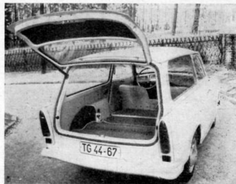
Bild 5 Blick auf die Ladefläche im Trabant 601, die nach Umklappen der Fondsitzbank entsteht

Die einfache Innenausstattung ist mit der der Limousine gleich. Die Auskleidung besteht aus hellen Plastfolien, die Polsterbezüge aus strapazierfähigem, aber wegen seiner hellen Tönung etwas empfindlichem Stoff. Die Holzplatten der Ladefläche sind mit dunkelgrauem Bouclé bespannt. Die Verarbeitung durch den VEB Karosseriewerke Meerane war sauber und einwandfrei ausgeführt worden.