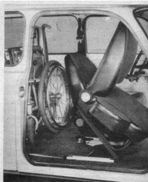
Bild 2 Der Beifahrersitz hat eine zusätzliche Kissenverbreiterung und ist vollständig nach vorn kippbar

die bekannte Schutzwirkung. Die Aufrollautomatik erspart eine individuelle Einstellung. Zur Erhöhung der passiven Sicherheit ist die rechte Seitentür von außen verschließbar, damit das Aus- und Einsteigen von dieser Seite aus bevorzugt werden kann. Zusätzlich sind innen über beiden Vordertüren Haltegriffe angeordnet, die mit Verstärkungsschienen am Dachrahmen befestigt werden. Der Trabant 601 Universal mit Versehrtenausstattung hat außerdem eine elektrische Füllstandsanzeige für den Kraftstoffvorrat. Über Spezialwerkstätten und die Vertriebsbedingungen informiert die Tafel.