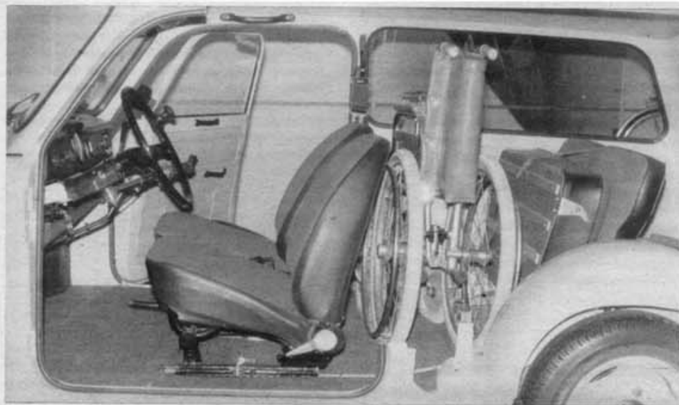
Bild 1 Das Schnittmodell des Trabant 601 Universal mit Versehrtenausstattung läßt die Transportmöglichkeit des zusammengeklappten Rollstuhles erkennen

Die Fahrzeuge werden mit der beschriebenen Ausstattung vom VEB Sachsenring an den IFA-Vertrieb ausgeliefert. Lediglich das zusätzliche Sitzkissen für den rechten Sitz liegt dem Fahrzeug bei und wird in einer Spezialwerkstatt montiert. Die Vollhandbedienung wird ebenfalls von einer der Spezialwerkstätten angefertigt und montiert. Dem Fahrzeug liegt weiterhin ein Lenkradknopf bei, der bei Bedarf von diesen Werkstätten montiert wird. Der IFA-Vertrieb übergibt diese Fahrzeuge an die Versehrten oder deren Beauftragten gegen Vorlage der Freigabe der bezirklichen Fachkommission. Danach wird das Fahrzeug einer Spezialwerkstatt für die erforderlichen Nachfolgearbeiten zugeführt.